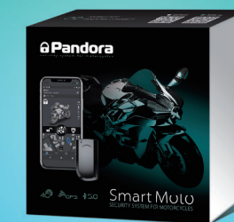
Pandora Smart Moto

A segurança telemétrica perfeita para motos e quadriciclos com um modem GSM 4G (LTE) de alta velocidade GPS / GLONASS preciso, Bluetooth 5.0 e bateria de backup reunida numa caixa compacta à prova d'água. O conjunto tem os mais modernos acessórios sem fio, incluindo sirene autônoma PS-332 e pulseira Pandora Band, que pode ser usada como um dispositivo de autorização do proprietário. O sistema consome apenas alguns miliamperes em pleno modo de operação.