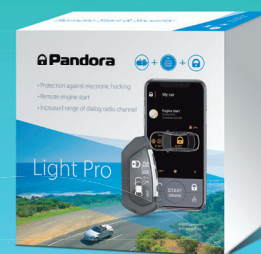
Pandora Light Pro

é um sistema de segurança remoto com Bluetooth 5.0. 2xCAN, LIN integrado Que permite instalar o sistema em quase todos os carros. A porta IMMO / KEY permite ultrapassar os imobilizadores de um grande número de carros. O sistema tem um controle remoto bidirecional criptografado com um grande display OLED. Novo 868 MHz com o LoRa estende o alcance do controle remoto até 2 km em uma área urbana. Um interface Bluetooth 5.0 integrado que permite estender seu sistema com uma vasta variedade de módulos adicionais e usar uma App móvel para controlar e ajustar seu sistema.