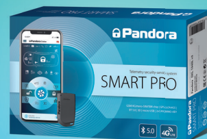
Pandora Smart Pro

é o primeiro modelo de uma nova geração de micro-sistemas com o modem 4G mais avançado, que suporta todas faixas de comunicação disponíveis (2G / 3G / 4G) Interface Bluetooth 5.0. Este sistema foi projetado para estar sempre em contacto com seu dono sob qualquer situação, em condições de má cobertura da rede GSM e mesmo na ausência dela, por meio de serviços online, por conexão direta via Bluetooth, ou usando o LoRa de longo alcance (* opcional extra).