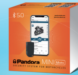
Pandora Mini Moto

Um sistema de segurança totalmente mãos-livres com um Bluetooth 5.0 que permite implementar Imobilizador e Funções anti-Hi-Jack, conectar sensores sem fio e relés de bloqueio. Usa o Tag ou smartphone como um dispositivo de autorização, ou pode usar o Pandora BAND para controlar o sistema de segurança. O estado do veículo está disponível na App móvel Pandora.